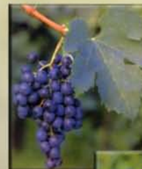
Мерло клон: - R3 - ISVF-V5 - 184