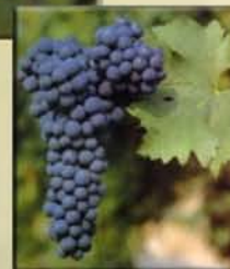
Каберне клон: - R5 - ISVF-V5 - 169

Подложките с които работим, добиваме от собствен маточник, засаден от базов посадъчен материал на фирма „ЦЕНКО -95“ООД, гр. Бяла. Сортът лозова подложка СО 4 се препоръчва за сортове лози, отглеждани при условията на Северна и Южна България, на по-дълбоки и по-плодородни почви. Подложката СО 4 се вкоренява много добре и има добър афинитет с повечето десертни и винени сортове лози. Присадените върху нея растения се отличават с дълголетие, с обилно плододаване и с качествено грозде. Подложката подобрява узряването на дървесината на присадниците и ги прави по-устойчиви на зимните студове.